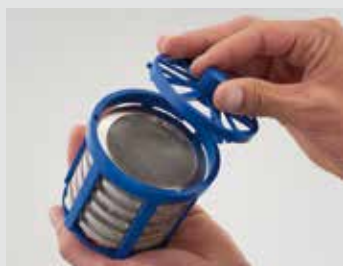
Remplir les paniers avec les pièces

Avec l'intégration de la technique sous vide et de tous les dispositifs de sécurité anti-déflagration exigés par le TÜV et les normes européennes, Elmasolvex VA dispose d'une protection anti-déflagration intrinsèque autonome. C'est-à-dire qu'avec les dispositifs de protection intégrés à la machine et en respectant un emploi strictement défini, tout danger d'incendie ou d'explosion est exclu. Désormais, l'application de la technique à ultrasons combinée à un système sous vide n'appartient plus au domaine de l'impossible, mais est devenue la résultante d'une vraie technologie possible et autorisée. Les contrôles effectués par l'organisme allemand « TÜV » ainsi que le label décerné, confirment que les contraintes pour l'obtention de la certification CE ont bien été respectées.