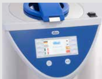
Sélectionner le programme et démarrer