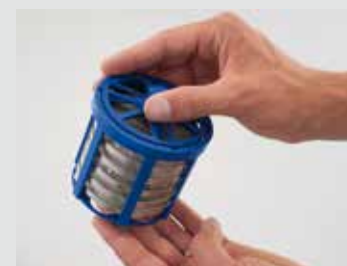
Sortie des paniers nettoyés et séchés