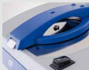
La mise sous vide est en cours