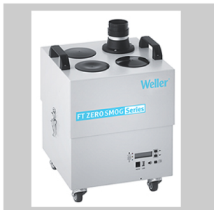
Dispositifs d'aspiration des fumées de soudage