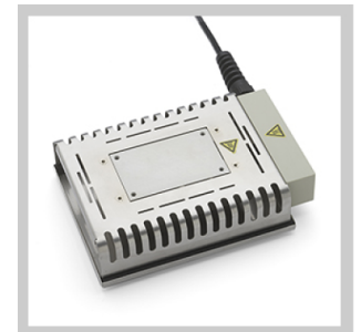
Platines de préchauffage