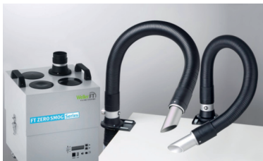
Zero Smog 4V Kit