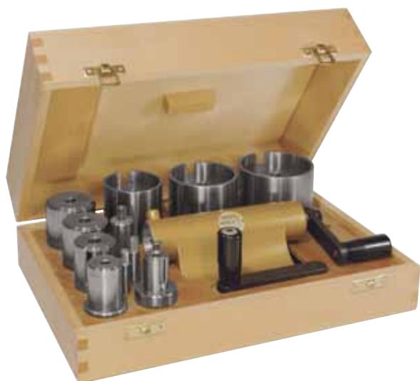
Etui complet - Vollständiges Etui Complete case - Estuche completo

Este surtido se compone de una solida armadura-soporte de hierro fundido, esmaltado, que se fija al tornillo de banco. De 2 manivelas y 8 tases-tambores. La estrapada BERGEON permite colocar sin peligro ni esfuerzo los muelles mas fuertes para relojes de pared, pero tambien muelles para contadores y despertadores. La estrapada puede utilizarse para enrollar muelles a la izquierda y a la derecha. En estuche de madera.