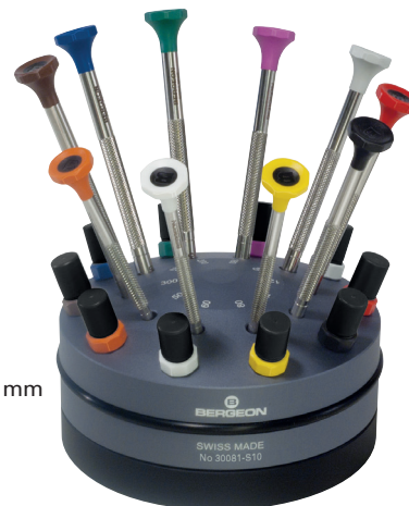
Ø 90 mm

Jeu de 9 tournevis sur socle tournant. Avec emplacement pour les mèches de rechange.