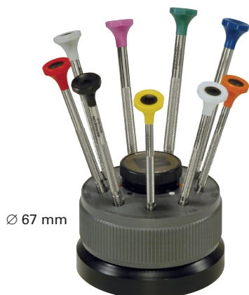
Ø 67 mm

Cuerpo y mango: Acero inoxidable. Cabeza: De materia sintética POM autolubrificante. Mechas: De acero inoxidable endurecido, 54 HRC, ref. 6899-M.