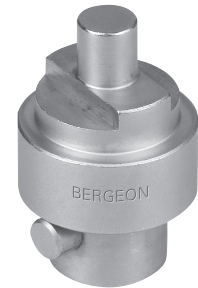
Tasseau intermédiaire Zwischeneinsatz Intermediate holder Tas intermedio