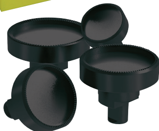
Assortiment de 4 tasseaux - Sortiment von 4 Stempeln Assortment of 4 heads - Surtido de 4 tases