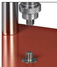
Pour tasseaux à visser