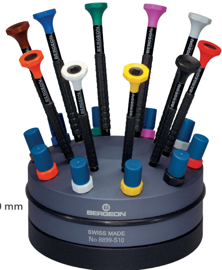
∅ 90 mm

Jeu de 9 tournevis sur socle tournant. Avec emplacement pour les mèches de rechange.