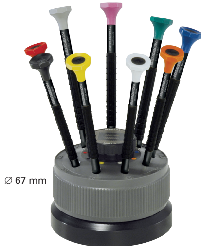
∅ 67 mm

Cuerpo: Aluminio anodizado. Mancha: Guarnición elastómero TPE. Cabeza: De materia sintética POM autolubrificante. Mechas: antimagnéticas-Declafor 1015, ref. 8899-M.